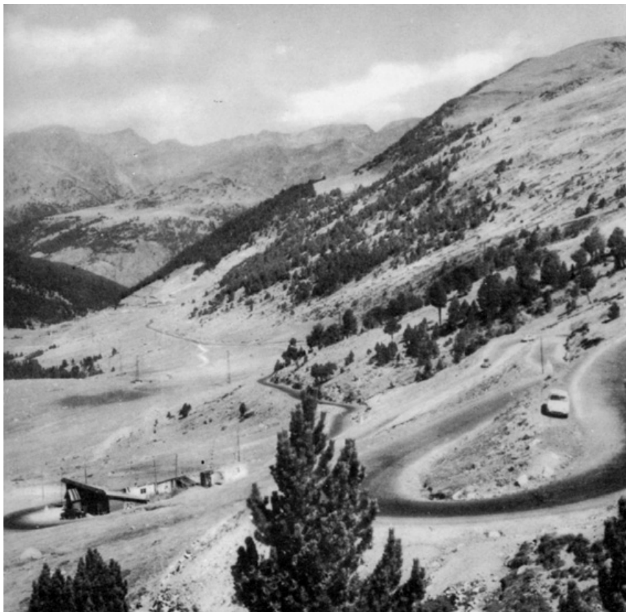
El refugi d'Envalira, camí del Pas de la Casa