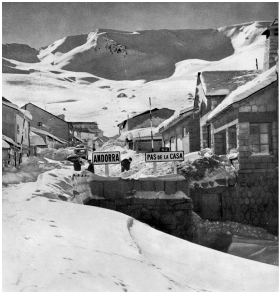
El paradís blanc al Pas de la Casa