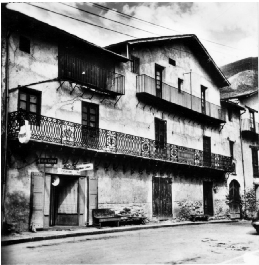
Casa Areny de Plandolit a Ordino