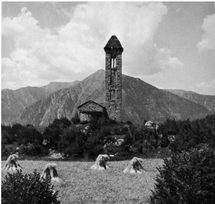
Sant Miquel d'Engolasters a Escaldes