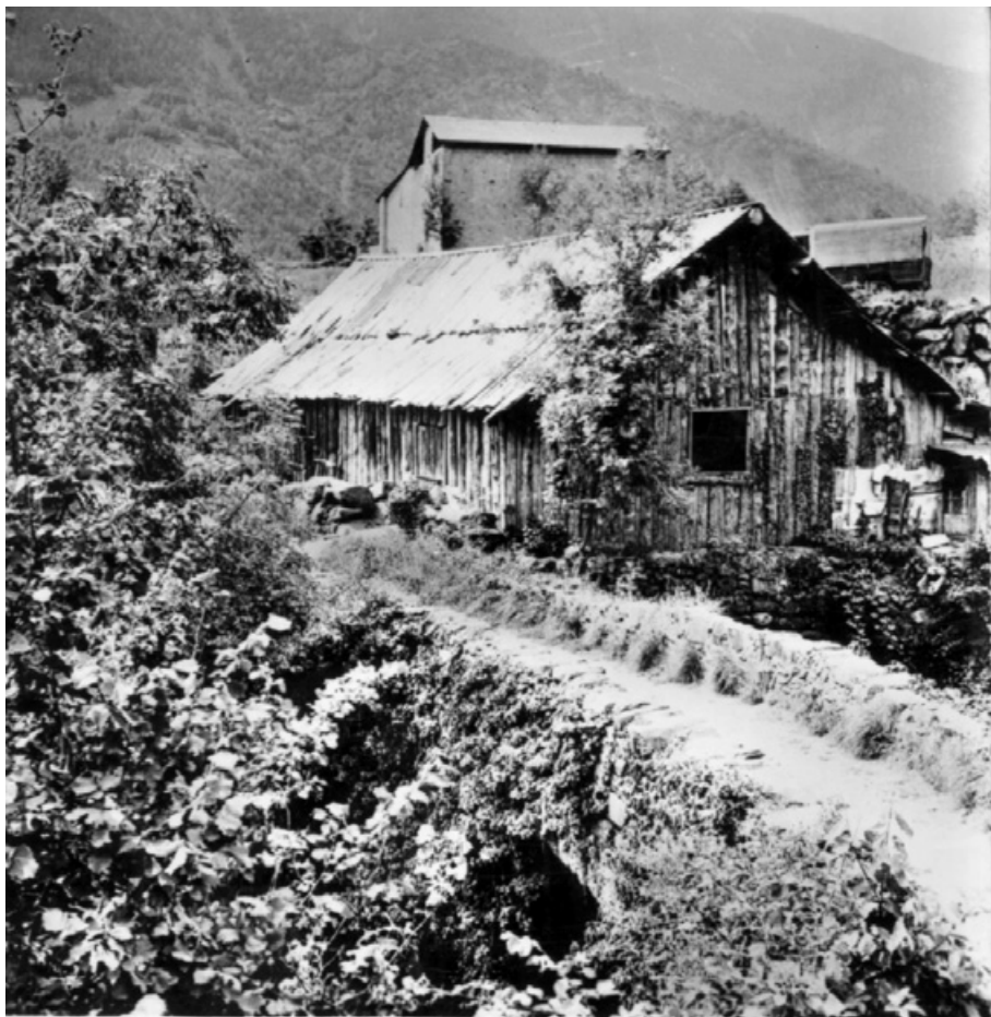
Pont dels Escalls a Engordany