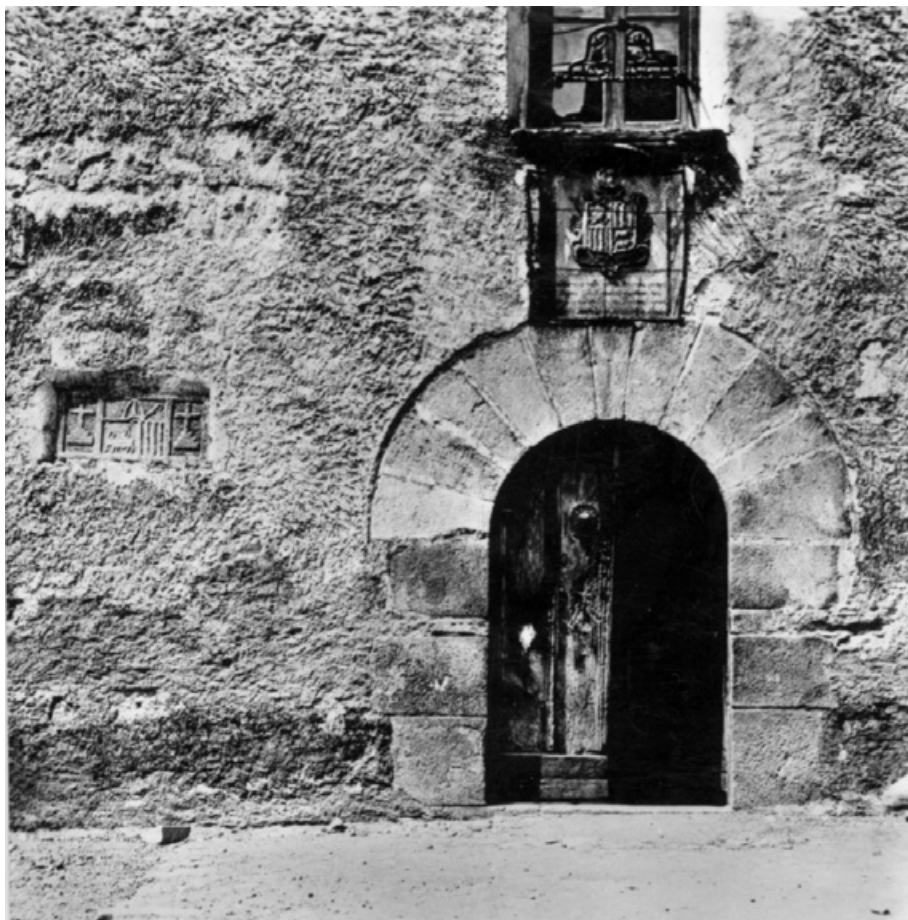
L'entrada a Casa de la Vall a Andorra la Vella