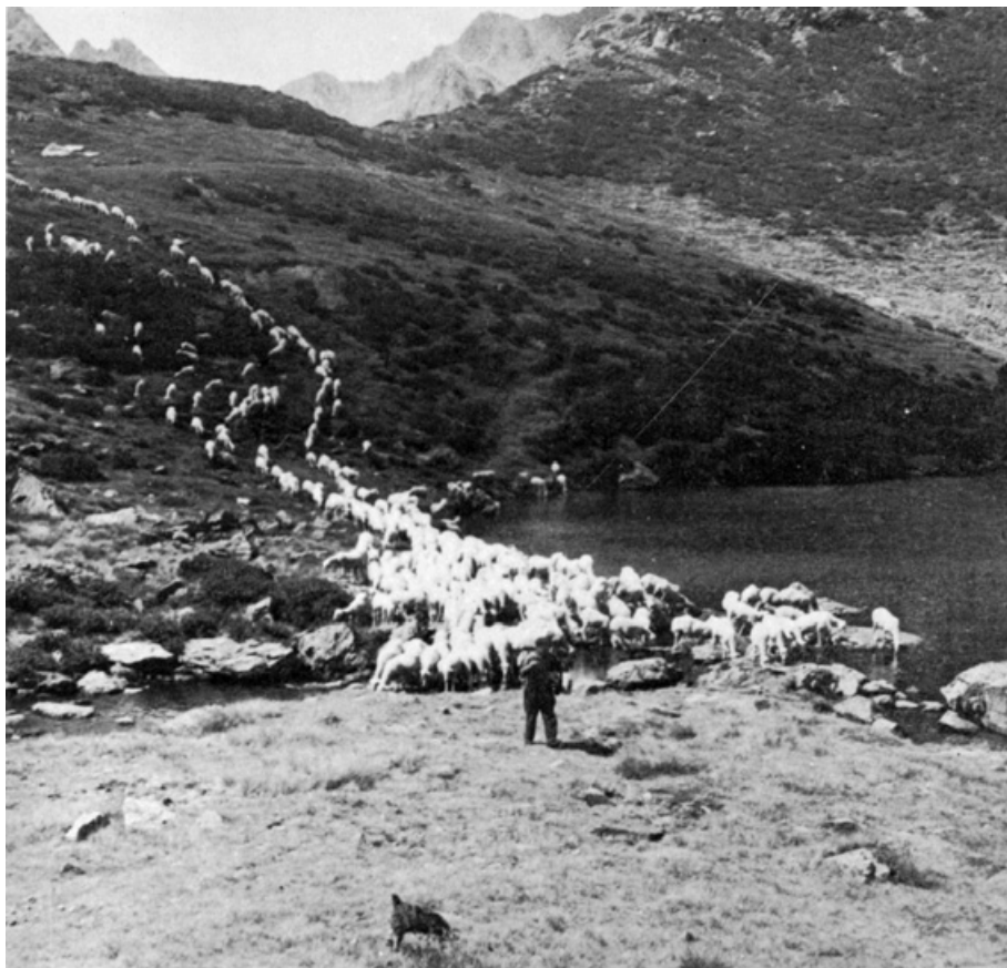
Els llacs de Tristaina a Ordino