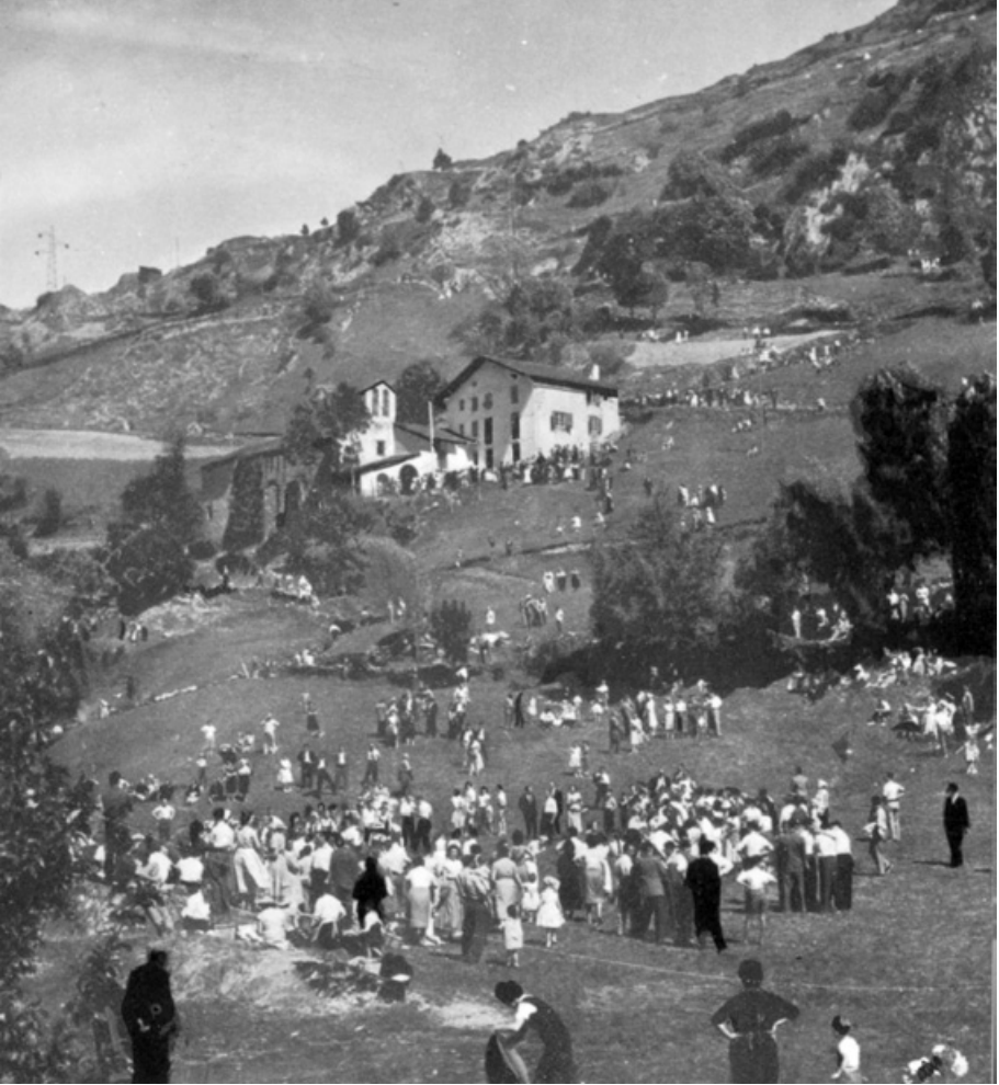
La festa nacional: l'aplec de Meritxell