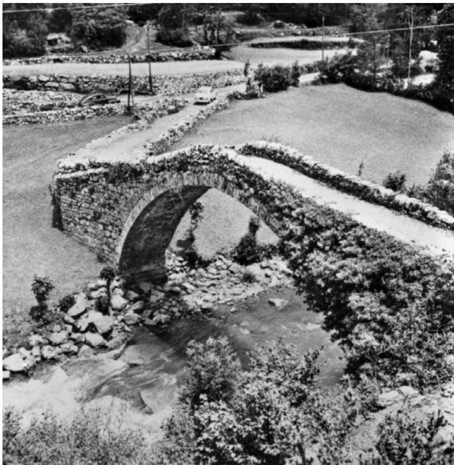
Pont de la Margineda a Santa Coloma