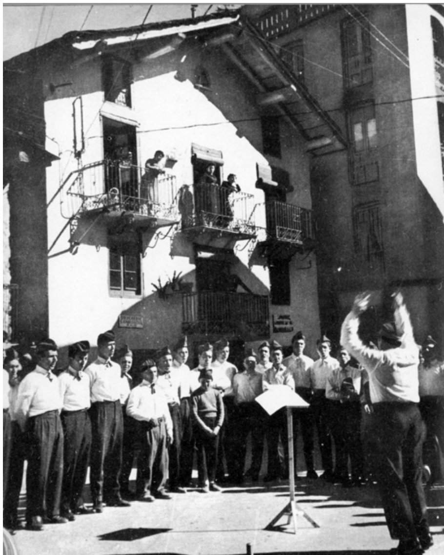
Les caramelles a Encamp