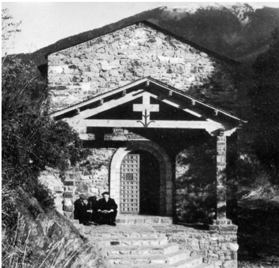
Sant Andreu a Andorra la Vella