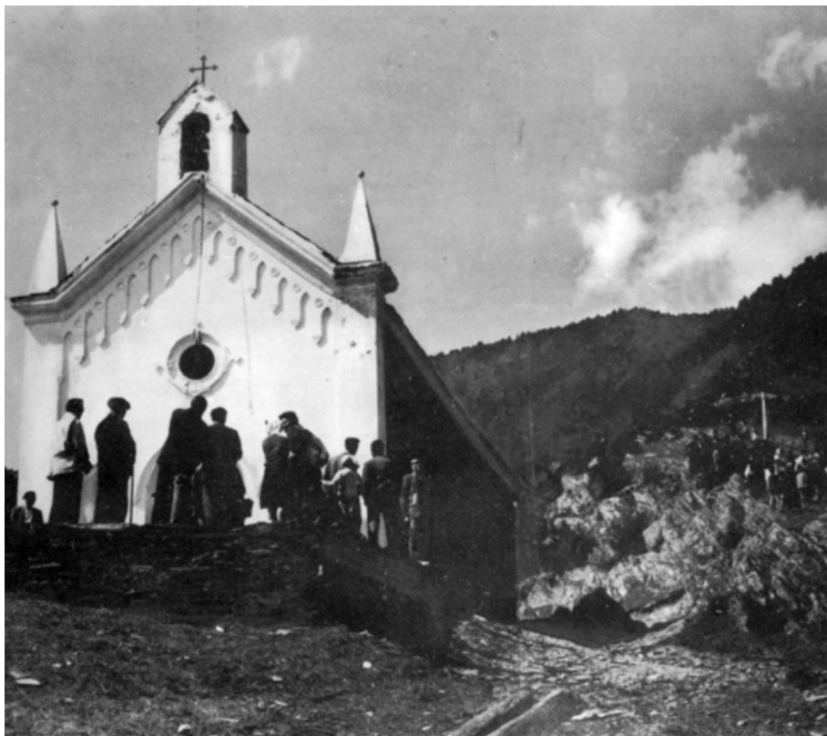
Canòlich a Sant Julià de Lòria