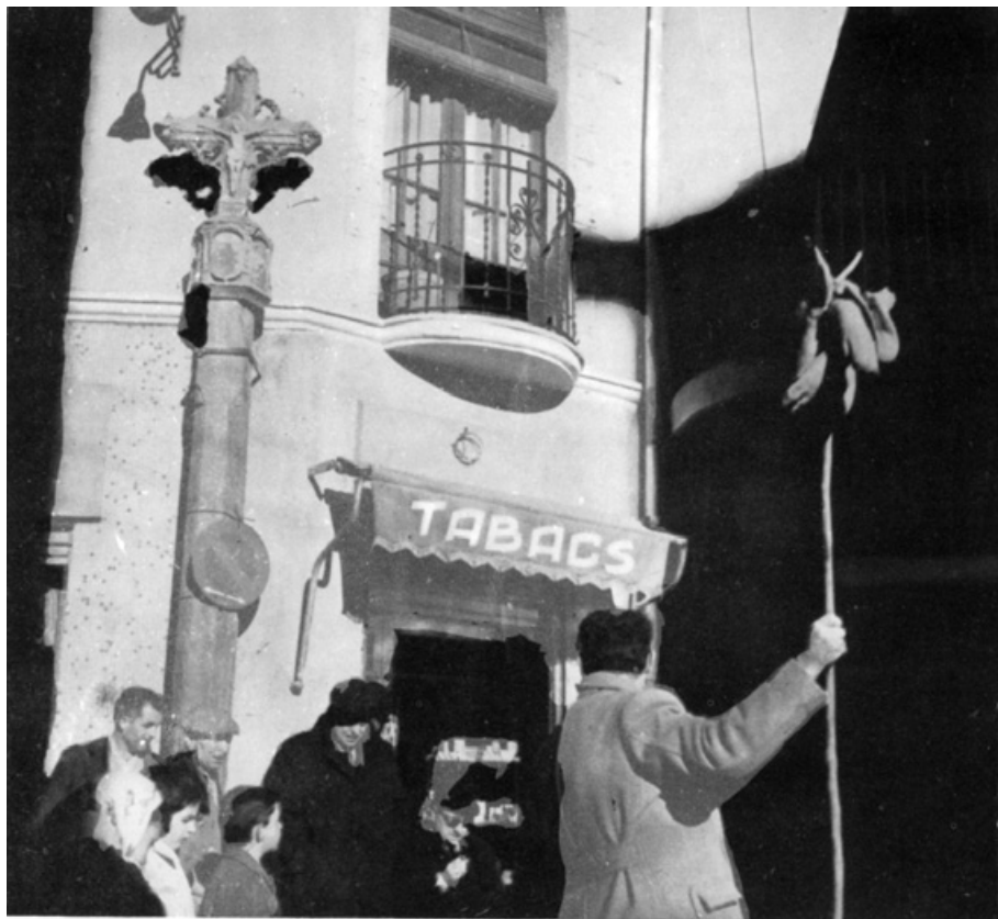
Els encants de Sant Antoni a Escaldes