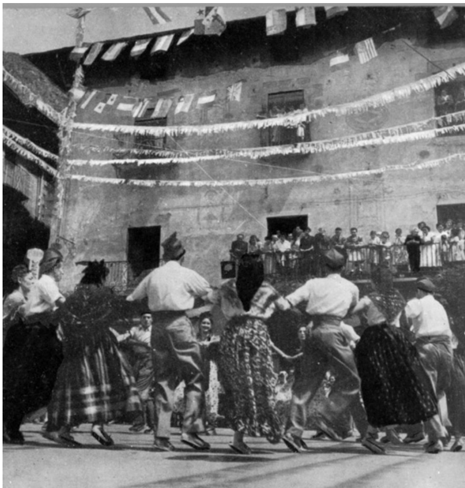
La festa del poble: la festa major a Andorra la Vella