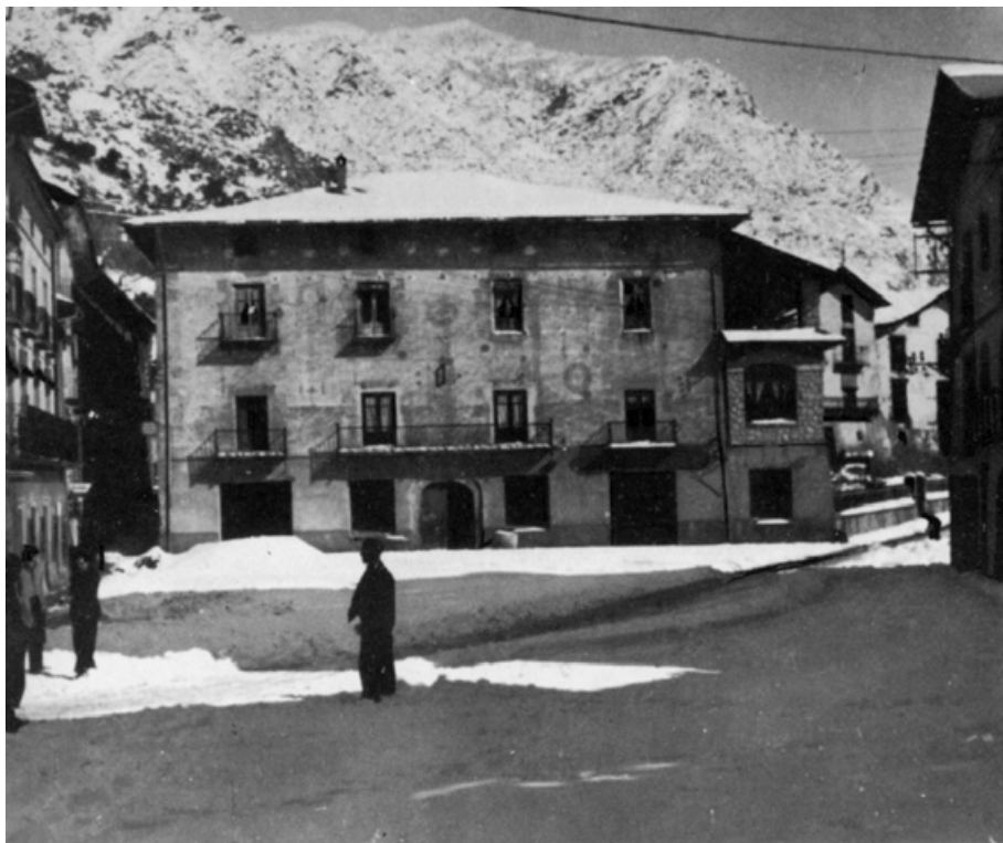
La plaça del Príncep Benlloch a Andorra la Vella