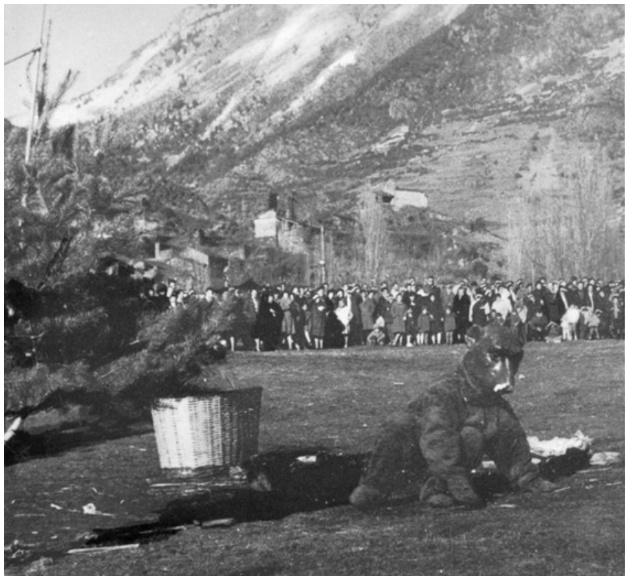
La dansa de l'ós a Encamp