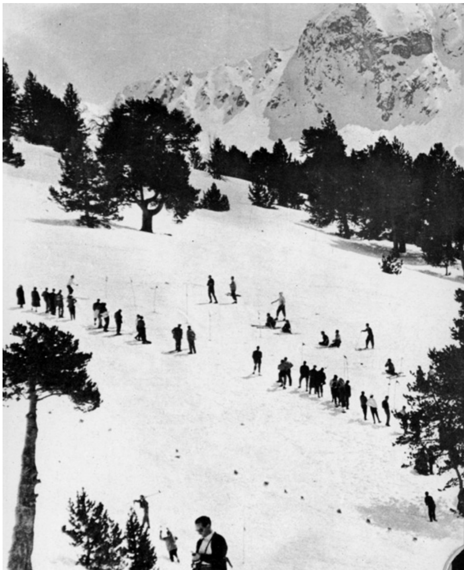
El concurs d'esquí de Pasqua