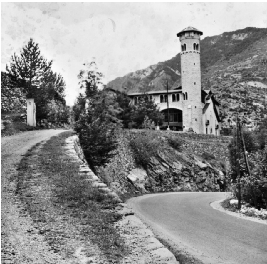
Ràdio Andorra a Encamp